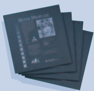
DIE MITSUBISHI SILVER DIGIPLATE POLYESTERPLATTEN

Die bedienungsfreundliche Bauart des DPX 4 erlaubt einen schnellen und unkomplizierten Austausch der Chemikalien in Minutenschnelle.